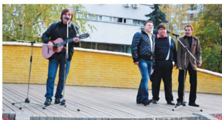
Песни Высоцкого актуальны и в наши дни

- Наверное, заключила она, есть у кого-то и другие любимые фильмы с участием Володи... И я думаю, что всякий раз, когда они