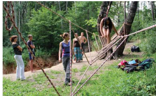
Дорога по «Тибетскому мосту»

палатку. В этом испытании оценивалась не столько скорость, а сколько качество выполненной работы. Некоторые наскоро воздвигнутые «домики» рушились при первом же легком ветре. Их приходилось снова устанавливать, соблюдая уже при этом все требуемые правила. По окончании соревнований все участники